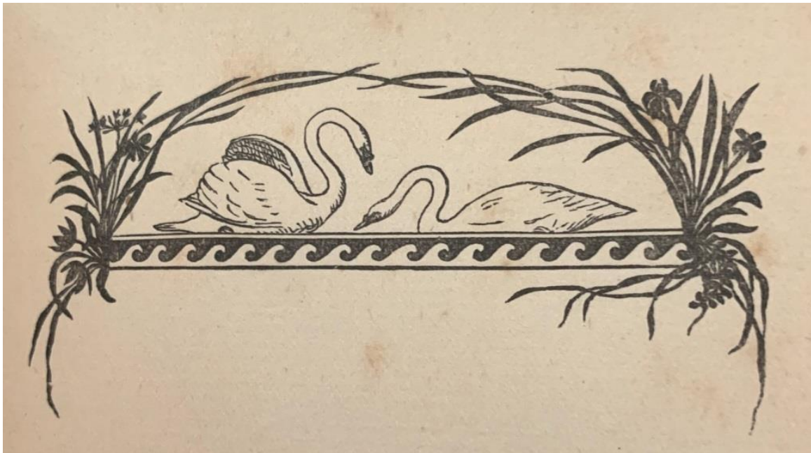
Illustrasjon fra siden med dikt nummer 1. Illustratøres navn er dessverre ikke oppgitt.

I det første diktet, som heter Døden og Drømmen, heter det i første vers: